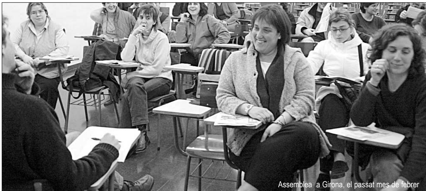
Assemblea a Girona, el passat mes de febrer

L a política duta a terme en els últims quatre anys per part del Departament ha suposat per al col·lectiu de professorat interí/substitut una major fragmentació i precarització i una situació d'inseguretat permanent com mai no hi havia hagut.